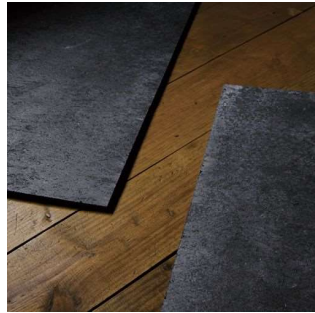
自然の風合いをそのままに時間とともに変化をする。