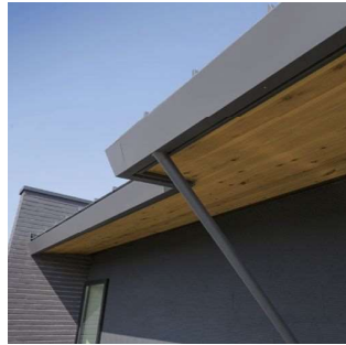
設計段階から取り入れる、新しい雨とい。