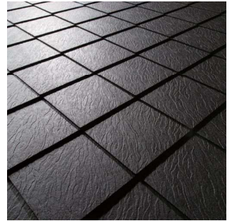
先進のデザイン性で外観美(屋根/外壁)を高める新ブランド登場。