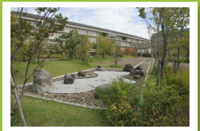
京都学園大学 京都太秦キャンパス 雨庭