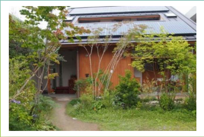
雨水ハウス（福岡市）