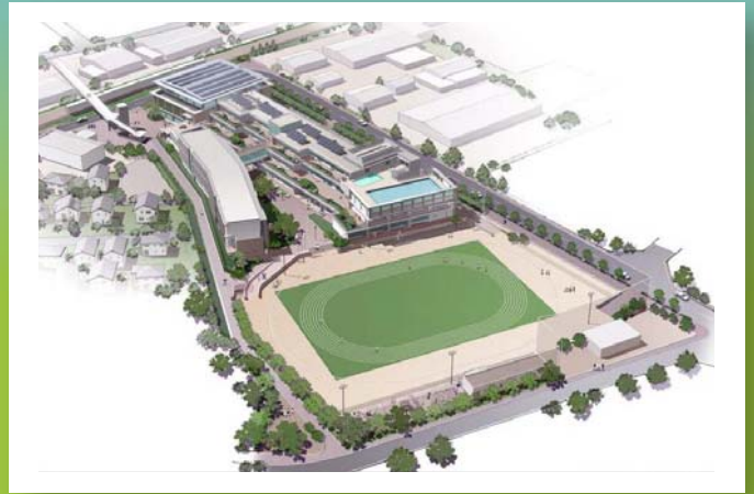
雨水小学校（新宮北小学校）