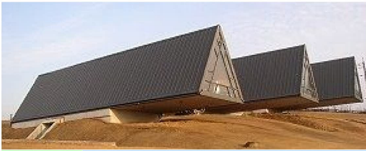
福智町立ふれあい塾 (葉祥栄 / 葉デザイン事務所)