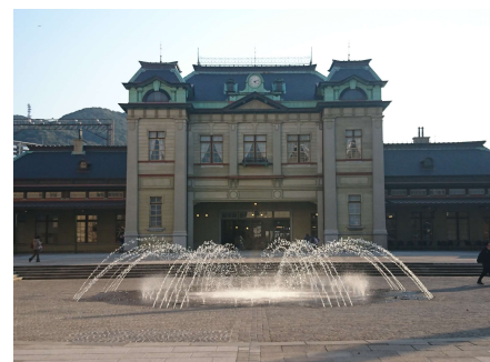
門司港駅(旧門司駅)

お申込方法 次頁の「参加申込書」をご覧ください。お申込は 10月31日(火)までに