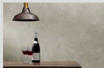
新製品：ファインモルタル

シンプルな素材でありながら人気の高いモルタル仕上げ。独特の風合いを左官で再現した新製品「ファインモルタル」を開発いたしました。また、エイジング風の豪華な仕上げで人気の高い「ファインFR工法」も最新の事例と共にご紹介いたします。