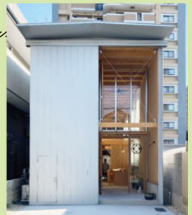
【住宅の部 大賞作品】houseG / shopG 一級建築士事務所木村松本