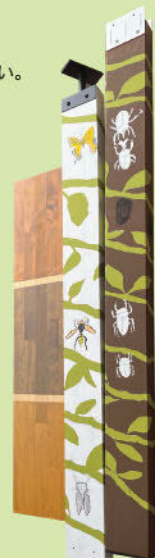
【学生食堂空間の音響性能評価】(卒業研究)