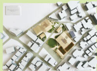
【発達障がい児の自立支援とその母親の"居場所"の在り方】(卒業設計)