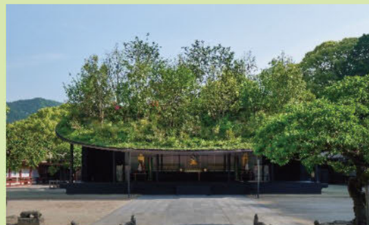
【一般建築の部 大賞作品】太宰府天満宮 仮殿 (©阿野太一) 株式会社藤本杜介建築設計事務所

「福岡県美しいまちづくり建築賞」は、福岡県内の個性豊かで美しく、良好な景観を形成する建築物を表彰し、美しいまちづくりに対する県民意識の醸成を図ることを目的として実施しています。今回は、ご応募いただいた47の作品の中から、幅広い分野の学識経験者などで構成する選考委員会による厳正なる審査を経て、特に優れた作品が大賞、優秀賞として表彰されました。