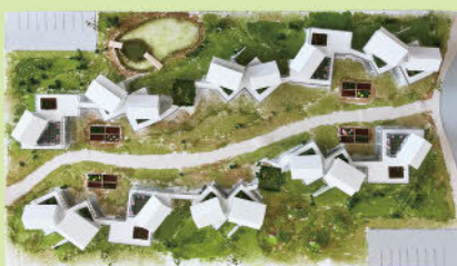
【人と人、人との社会の距離に注目した集合住宅の設計】 (卒業設計)

九州産業大学 住居・インテリア学科では、豊かで潤いのある暮らしを創出する住居・インテリア領域の技術者の育成をめざしています。学生たちが卒業制作及び卒業研究として取り組んだ成果を展示いたします。