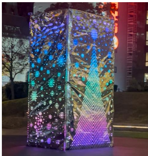
インタラクティブオブジェ