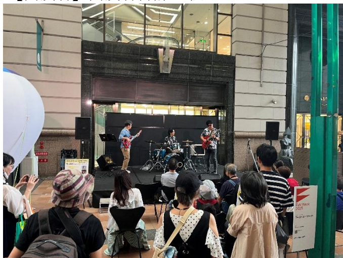
エルガーラ・パサージュ広場