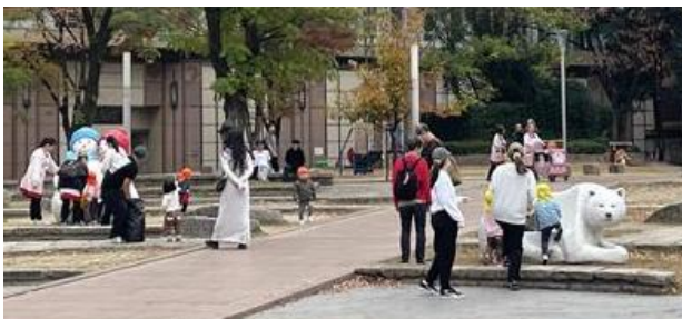
サンタ等オブジェ