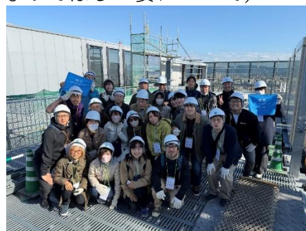
参加者で集合写真