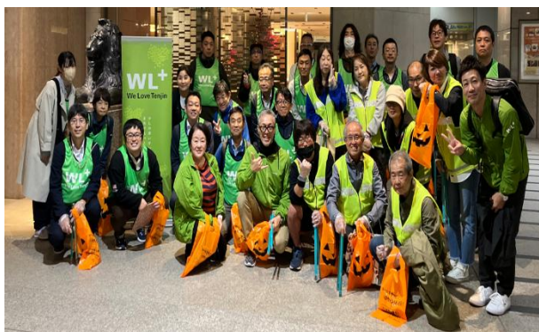
参加者で集合写真

【内 容】 ①天神地区6箇所でかぼちゃのゴミ袋を配布しゴミ持ち帰りの啓発活動 ②天神地区周辺の清掃活動