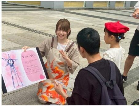
天神まちなかアート体験