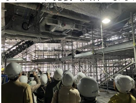
建設中のアトリウム空間